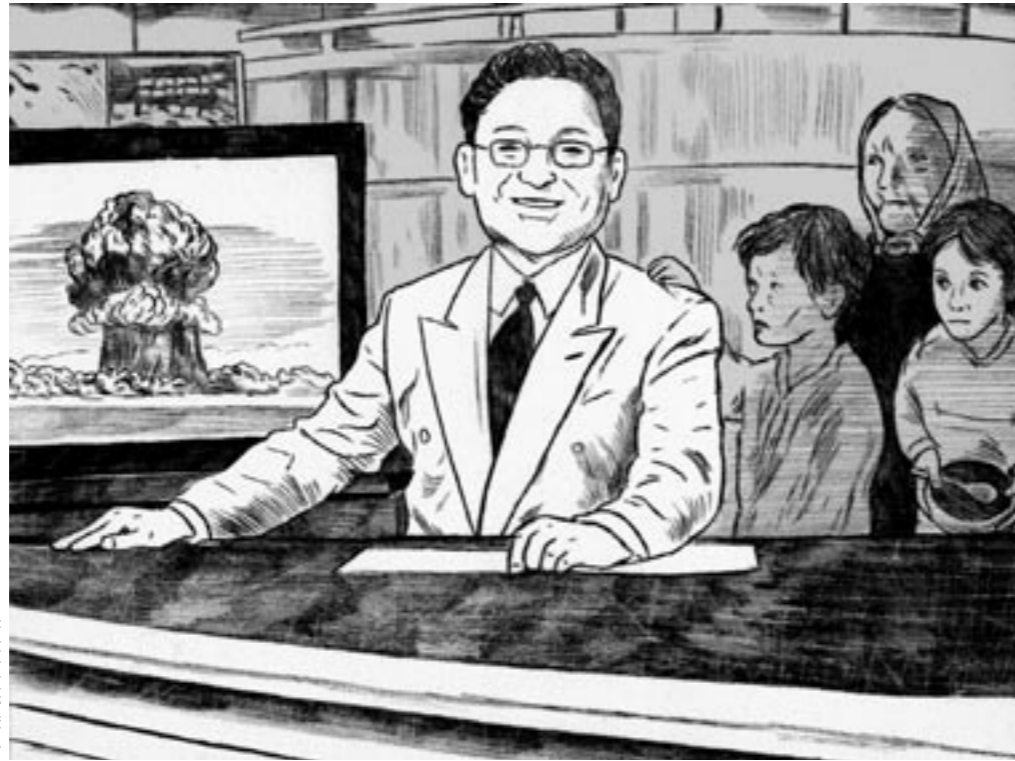
איור: רות גיילי

אפשר לשאול: מה נשמט בגלל האהבה של חדשות ערוץ 2 לדרמה הרגשית, לזעזוע? נסינו מחשבתני: נווה, למשל, את הזמן והאנרגיה הטלוויזיוניים שהושקעו בתאי הורע של יגאל עמיר לעומת אלה שהושקעו, נאמר, בקיצוץ 30%