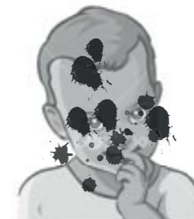
הכתבה נטענה כי יש לשים מניירות המאומצים בחו"ל מופנים בעיות נפשיות שונות. * כתבת טל הכריזה כי יש להפנות מומים ונפגעים וכן ילדים מאומצים לילדים שגדלו אצל הורים בינלאומיים

"ידיעות אחרונות" ניסה לשכנע את מועצת העיתונות כי התלונה אינה ראויה לדיון, אולם המועצה קבעה כי התלונה תידון בבית-הדין לאתיקה של המועצה. בית-הדין פסק נגד "ידיעות אחרונות", שיוצג עליידי עו"ד טלי ליבליך. בפסק-