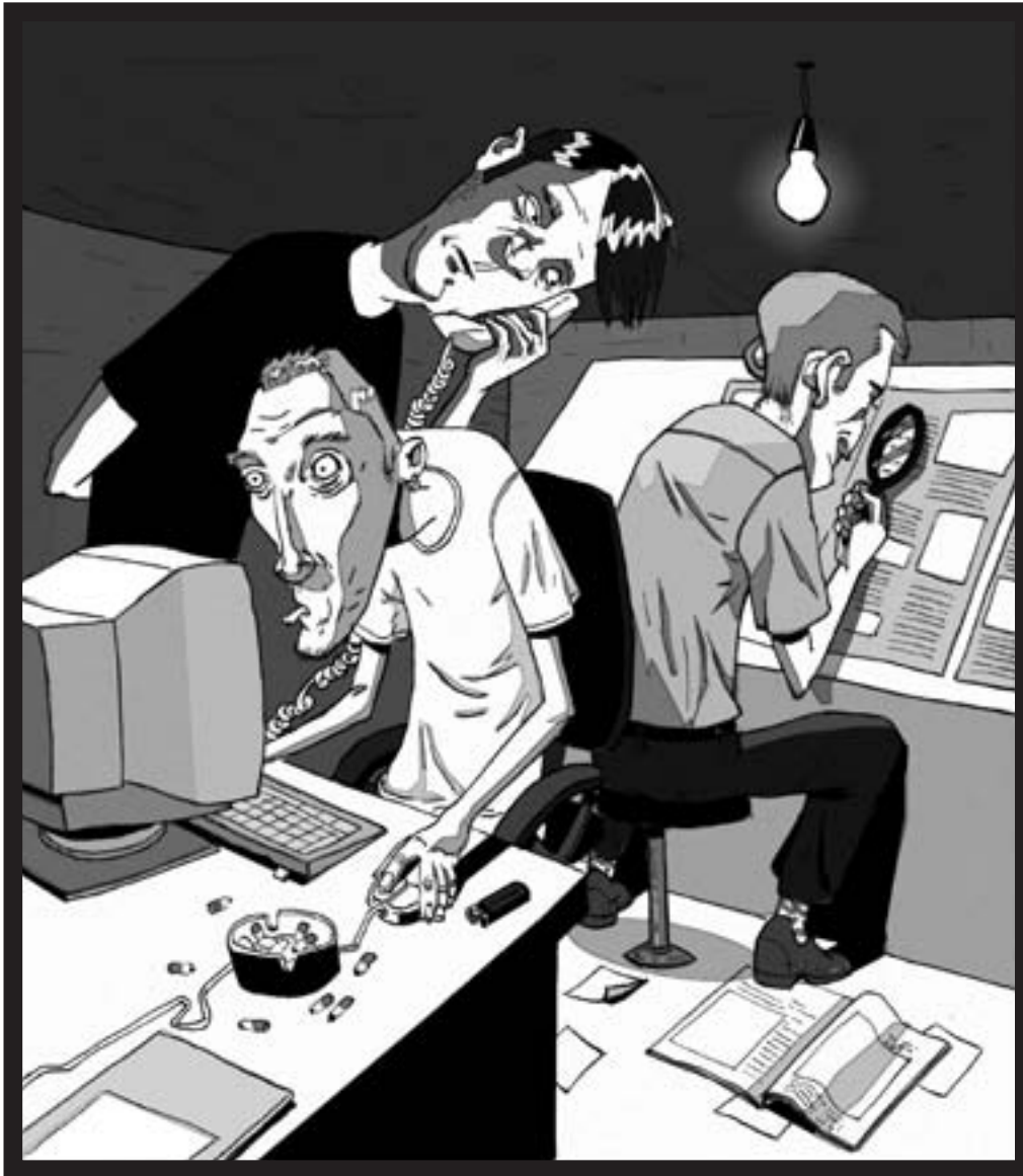
איור: אופיר שרר

הירחון החדש "כותרת" מתחרה בסביבה צפופה: שוק מגזינים עבריים שלא מפסיק להתרחב