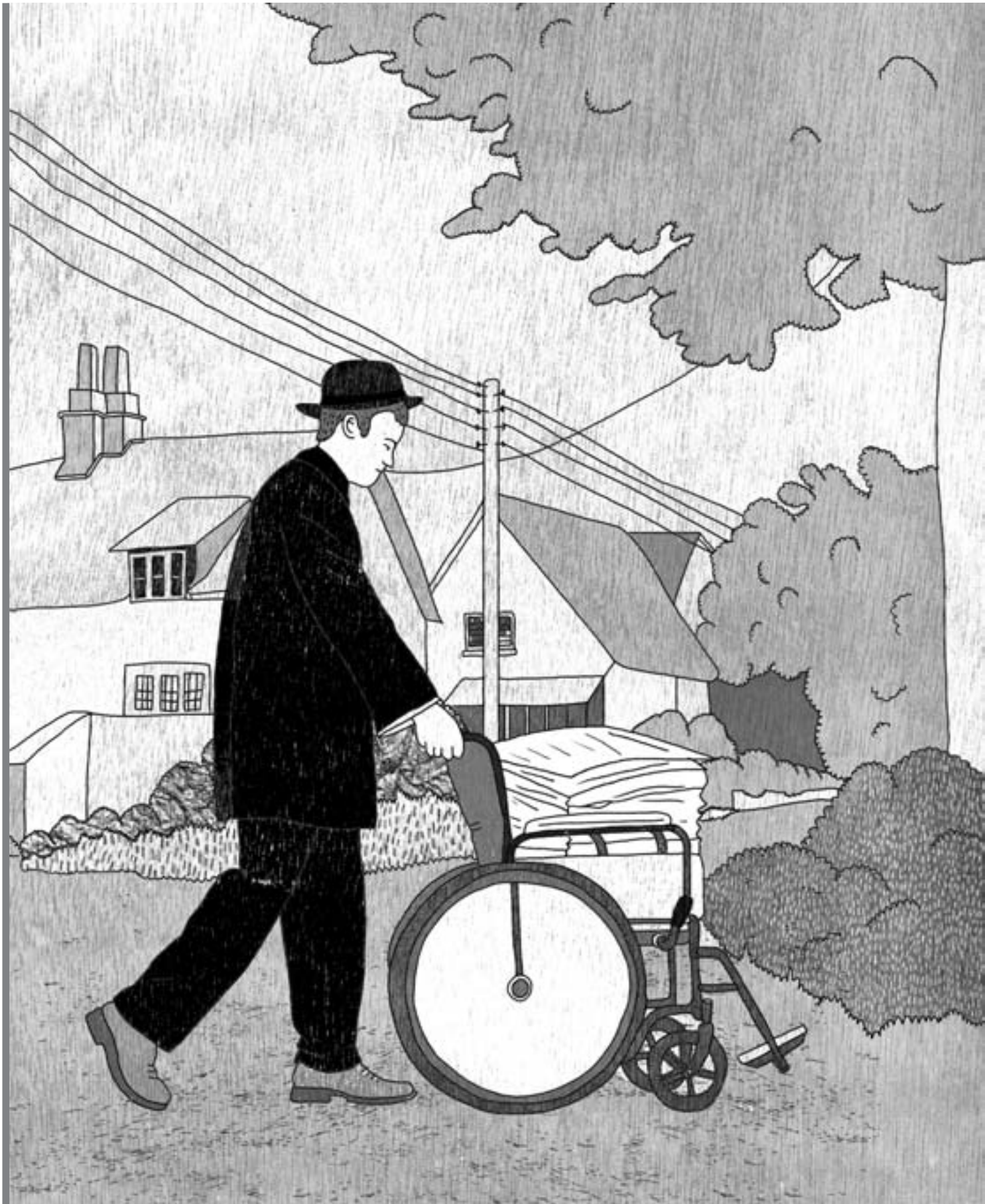
איור: בתיה קולטון