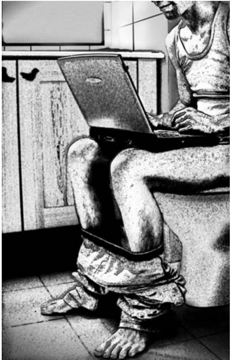
איור: אפרת בלוסקי

אשר לנו, העגלונים, מוכרי הקרח ומסיקי הקטרים מהעיתונות המודפסת, אנחנו נסתדר. הטלוויזיה לקחה לנו את הסלון ואת חדר השינה. האינטרנט לקח לנו את פינת המחשב. לא נותר לנו אלא להסתפק בחדר הקטן ביותר בבית. שם אין בינתיים אלטרנטיבה לעיתון המודפס