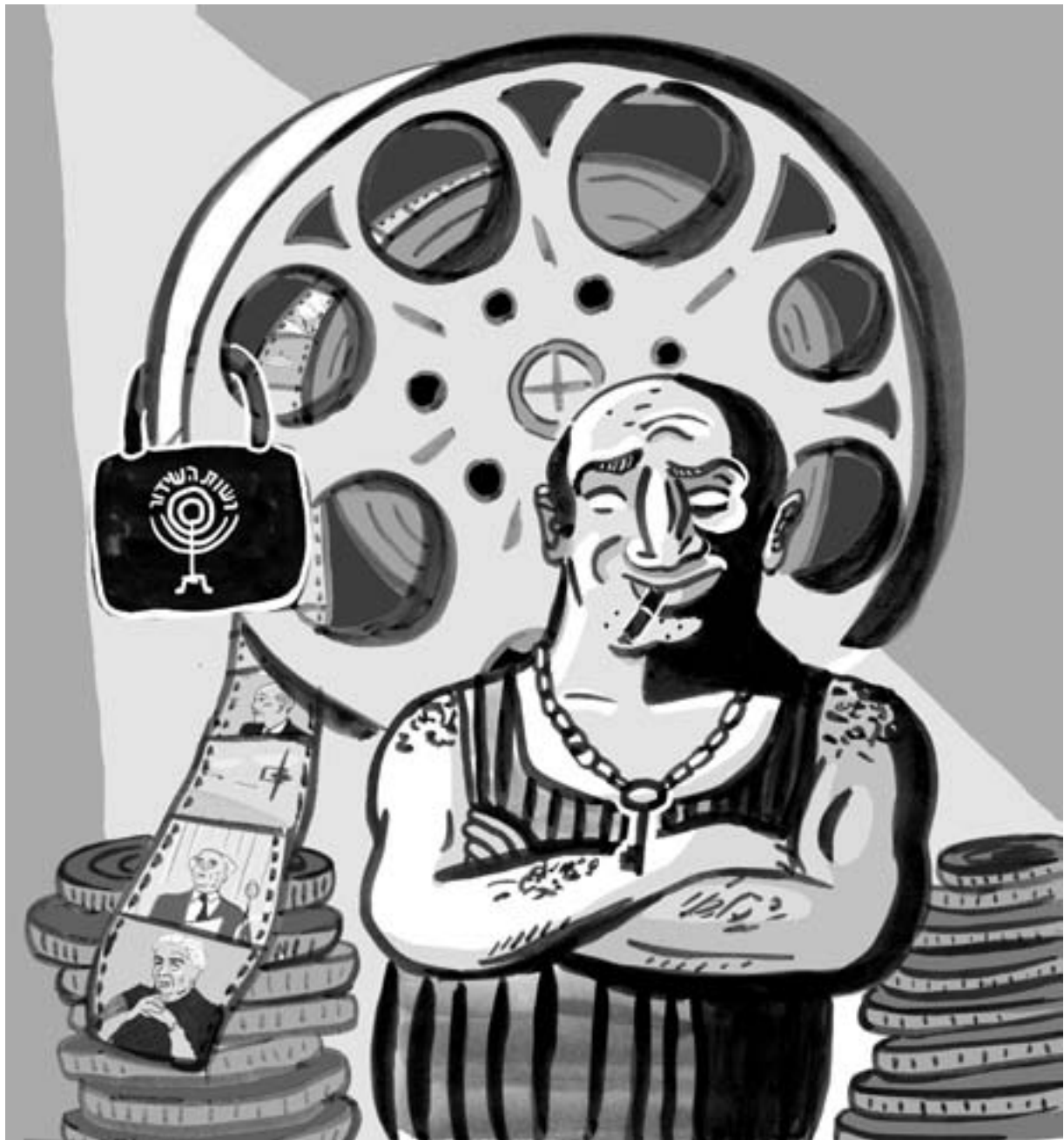
איור: אורית ברגמן

ארכיון רשות השידור מחזיק בנכסי צאן ברזל של תולדות מדינת ישראל. חלק נכבד מאירועי הרור האחרון אינו מתועד בשום מקום אחר. אין מדובר רק בתיעוד מימי המלחמות או בפרקים מהפוליטיקה המקומית, אלא גם בפסויות תרבות. כך למשל מחזיק הארכיון בקליפים ישראלים ראשונים, שאפשר היה לשרר בערוץ המוזיקה החדש. אלא שרשות השידור מחזיקה בקטעי הארכיון כקלף מיקוח נגד העולם: נגד הצופים שמעדיפים ערוצים אחרים, נגד האמנים, נגד הערוצים האחרים. לא לשם כך משלם לה הציבור אגרה.