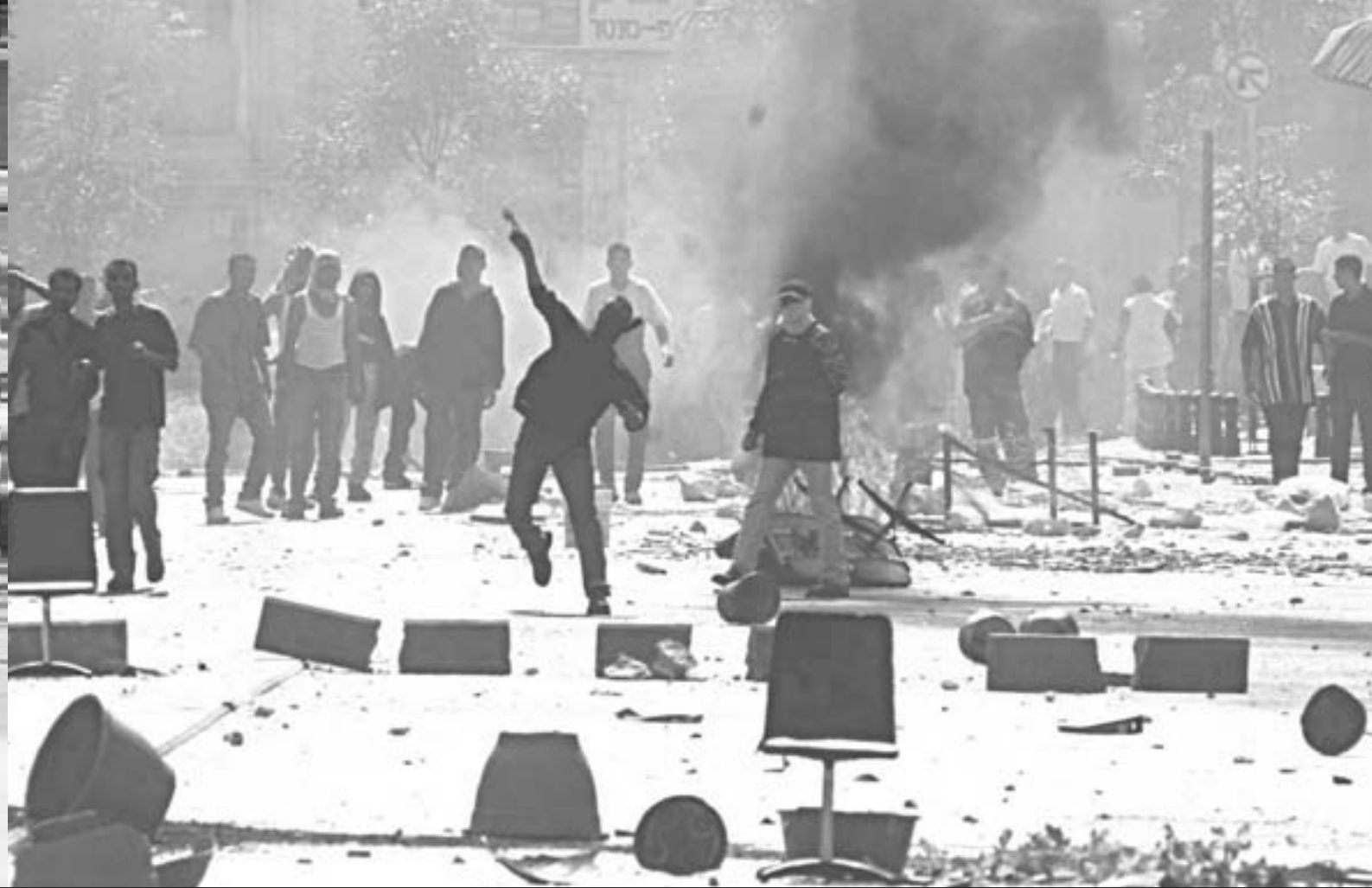
המשטרה היא המקור, המפגינים הם האויב: המהומות בנצרת, אוקטובר 2000