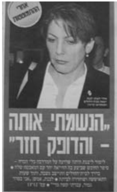
"ידיעות אחרונות" 26.11.03

למתמודד שעליו גבר, צ'ינו הבת־ימי בעל הסנסציות). מעל לכל, קבלתו אל השבט היא אקט מוכך.