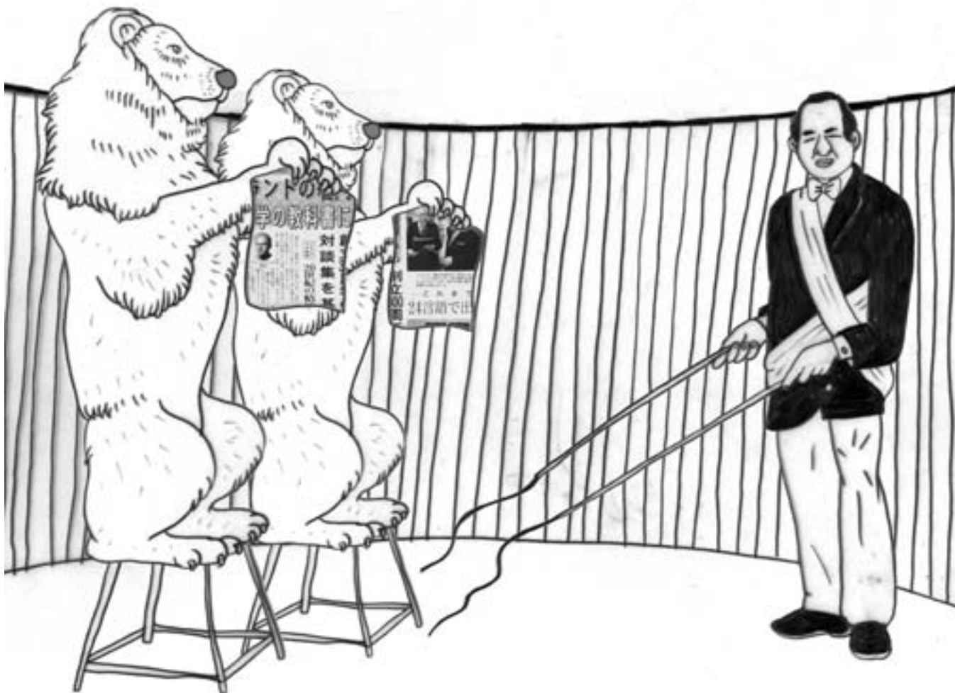
איור: בתיה קולסטון

שנים אחריכך עדיין נאבקים כתבים זרים בשיטה היפנית. בשנים האחרונות הצטרפו למאבק גם ממשלות זרות וארגוני כתבים בינלאומיים. האיחוד האירופי פנה רשמית באוקטובר 2002 לממשלת יפן, ותבע להסיר את המכשולים בפני זרימה חופשית של מידע על-ידי ביטול שיטת המועדונים ומתן גישה מלאה לכל התדרוכים במשרדי הממשלה. מידע זמין ושוטף, הנמסר לארגוני תקשורת בינלאומיים באותה שעה בדיוק שהוא מועבר לאמצעי תקשורת יפניים, חיוני לקיומו של מסחר חופשי. העדרו של מידע כזה הוא מכשול בלתי הוגן לזרימת סחר ומידע. גם הארגון כתבים-לא-גבולות מחה רשמית בפני היפנים.