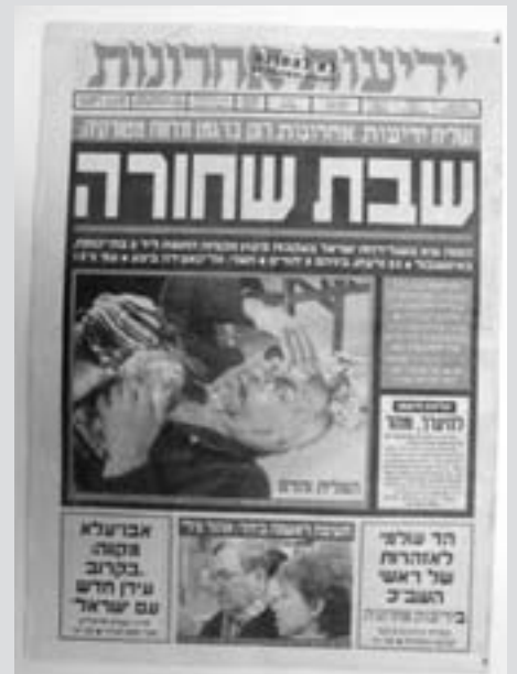
"ידיעות אחרונות", 16.11.03