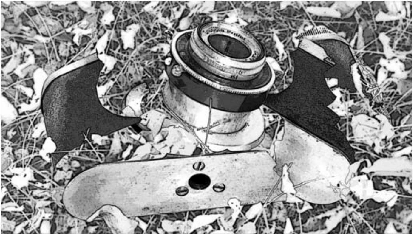
איור: אפרת בלוטסקי