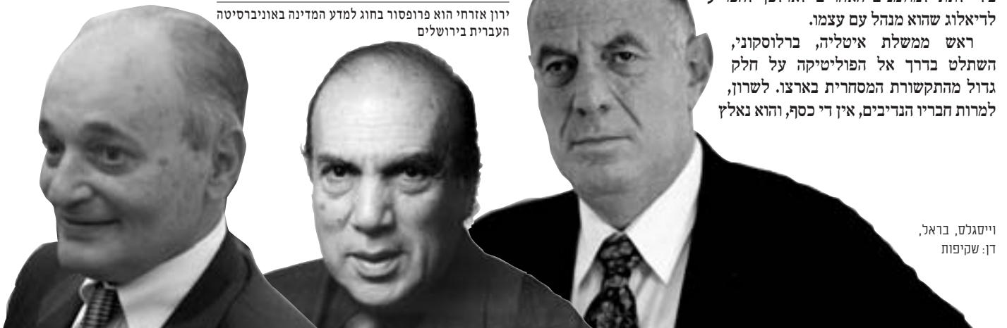
וייסגלס, בראל, דן: שקיפות

ירון אזרחי הוא פרופסור בחוג למדע המדינה באוניברסיטה העברית בירושלים