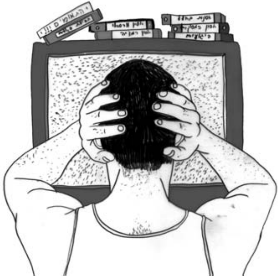
איור: בתיה קולטון

הראשונה בנושא כפי שפורסמה במדור לפני כמה שבועות), ייצא העיתון המתחרה אבל וחפוי ראש. אבל מי שסבור כך לא מבין בכלל את המשחק - העיתון המפסיד בסיבוב הזה יתעלם לגמרי מכל הפרשה. פיני בלילי וקבוצתו החדשה יעלמו כמעט לחלוטין מרפי המדור. החרבות תצוהצחנה והשריונים ימורקו לקראת הסיבוב הבא. כי הפסד בקרב אינו הפסד במלחמה, והליגה עוד ארוכה, את הכסף סופרים במדרגות, וזה לא נגמר עד שזה נגמר. ולמרבה הצער, במקרה הזה, המשחק הילדותי, הטיפשי והלא מקצועי הזה לא נגמר לעולם.