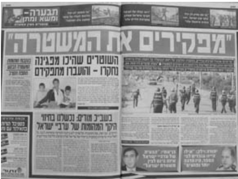
"מעריב" 5 באוקטובר 2000

את האנושיות של האנשים בהמון לכדי 'גוש' אחד שמטרתו הרס", "תחושת סלי-דה מהמתפרעים" וכדומה. לא קשה לרמיין שוטר קורא בבוקר את "ידיעות אחרונות" או את "מעריב". הוא קורא על מצב מלחמה, על הסכנה שבחסימת הצירים. ומעל לכל, כשהוא יוצא לעימות עם המפגינים, את מי הוא מצפה לפגוש? אזרח מפגין או אויב? קשה להשתחרר מן המחשבה שלפנייה של העיתונות לרגש הפחד הלאומי, להיתפסות להיסטריה עד כדי תיאור המצב כמלחמה, לחלוקה הברורה ל"הם" ו"אנחנו" והתייחסות "אליהם" כאיום, כ"גוש שחוסם צירים", היה חלק של ממש בהלוך הרוח המתלהם של הציבור ובכלל זה של השוטרים. על הרקע הזה, לא פלא שבסיקור העיתונות את ממצאי ועדת אור הוצנע המימד הרגשי של תפיסת הערבים כאיום, ובמקרים אחרים אף הוצדק בדיעבד. וכך כתב סבר פלוצקר במאמר המערכת של "ידיעות אחרונות" עם פרסום דו"ח