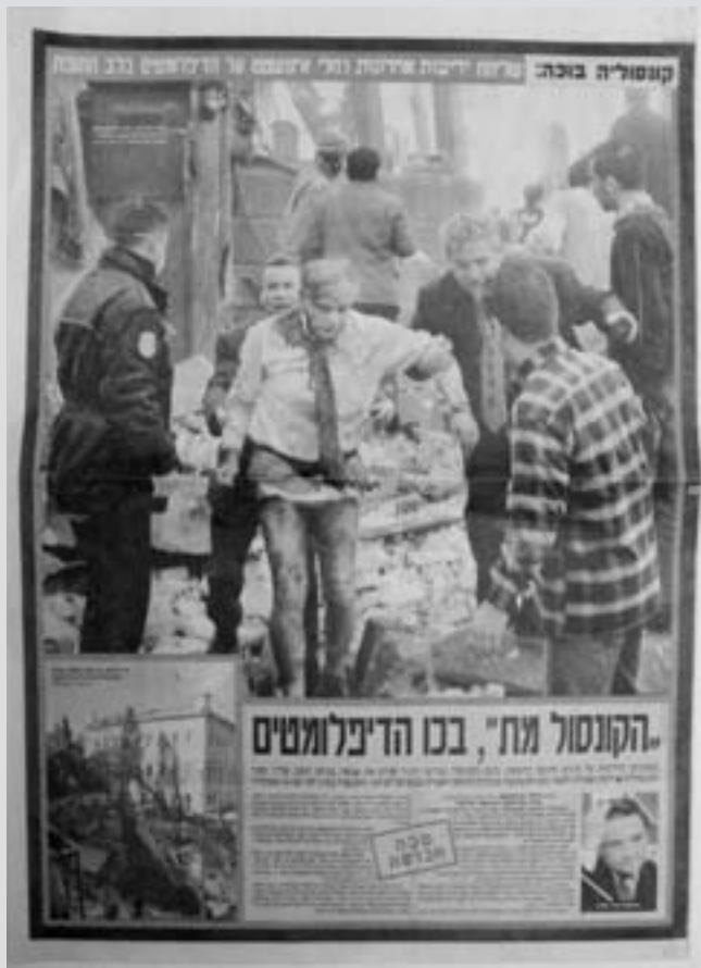
"ידיעות אחרונות", 21.11.03