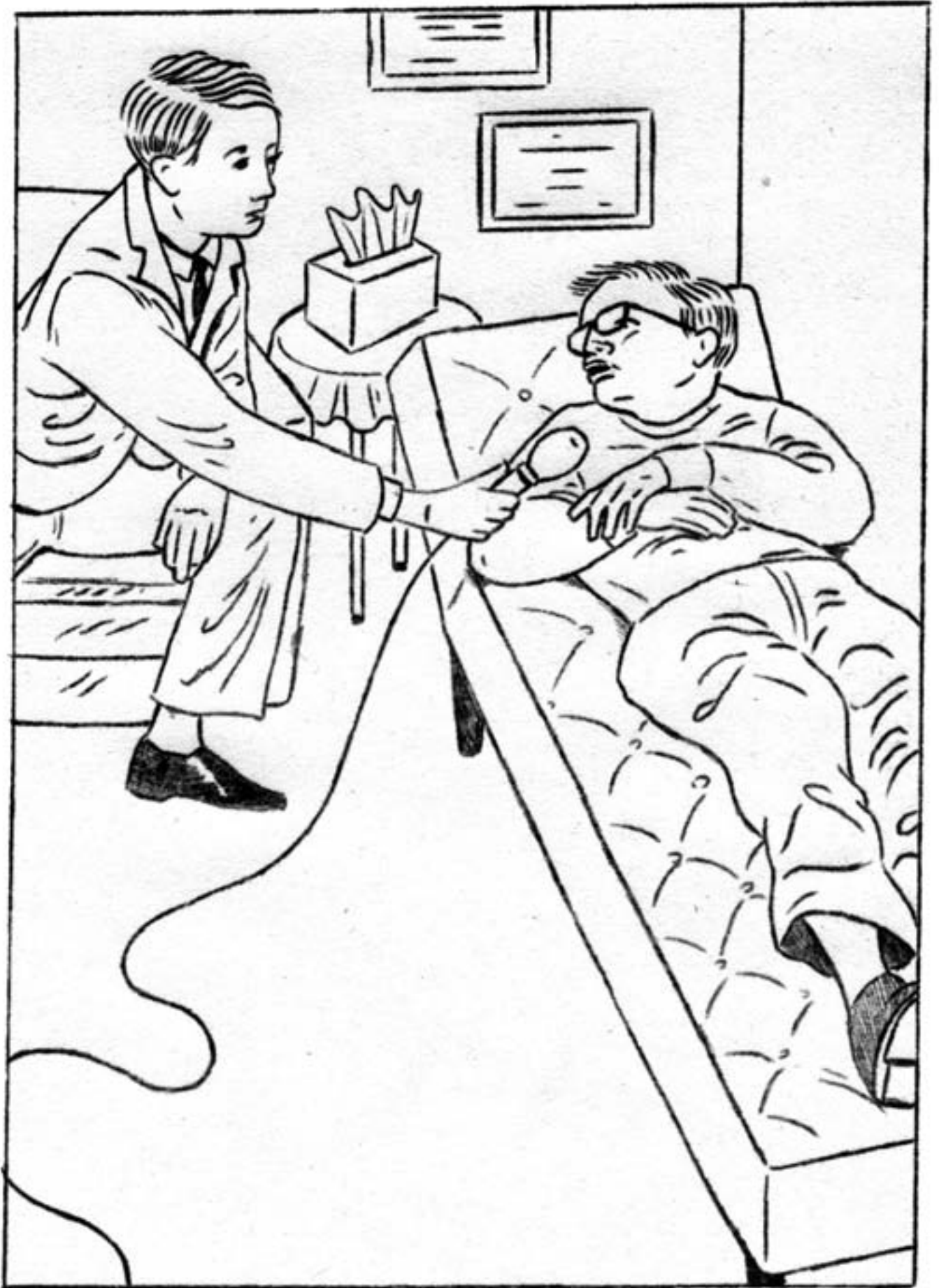
איור: רות גוינז