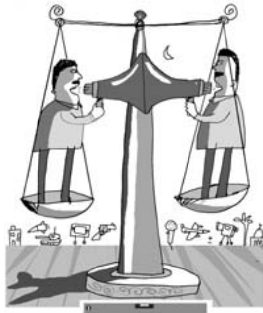
איור: עמותת אנלובוג

כידוע, מספר תושבי קטאר הוא כ-750 אלף, אין לה בעיות גבול, אין בעיות כלכליות ושתי הבעיות העיקריות שהיו למדינה, בעיית הגבולות שלה עם בחריין ונסיון מהפכה שנכשל, נפתרו, הראשון על-ידי בית-המשפט העולמי לצדק. שני הנושאים הללו טופלו