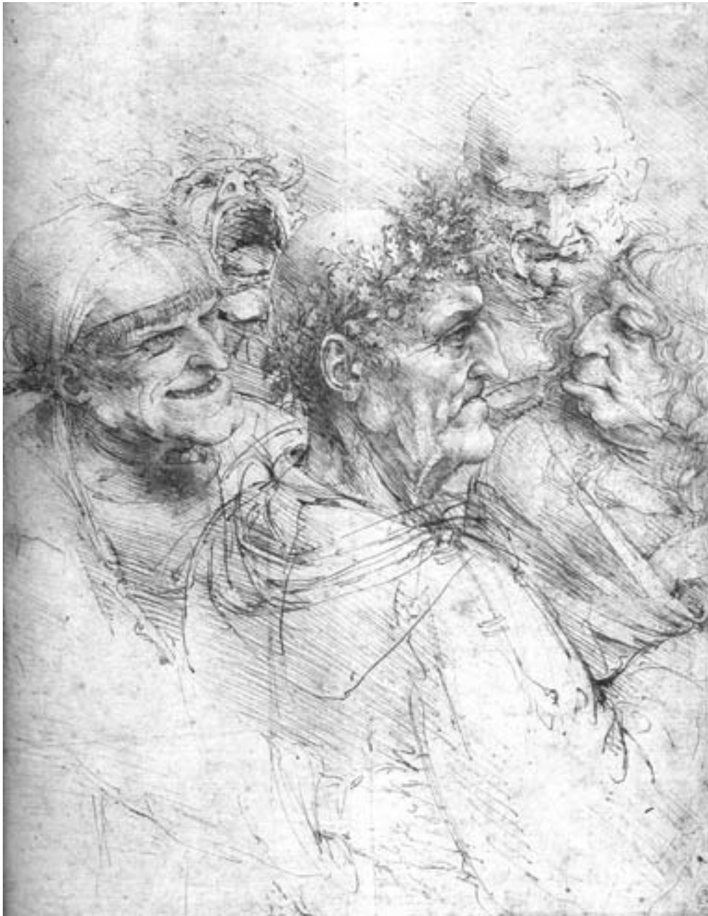
Leonardo da Vinci, Five Characters in a Comic Scene