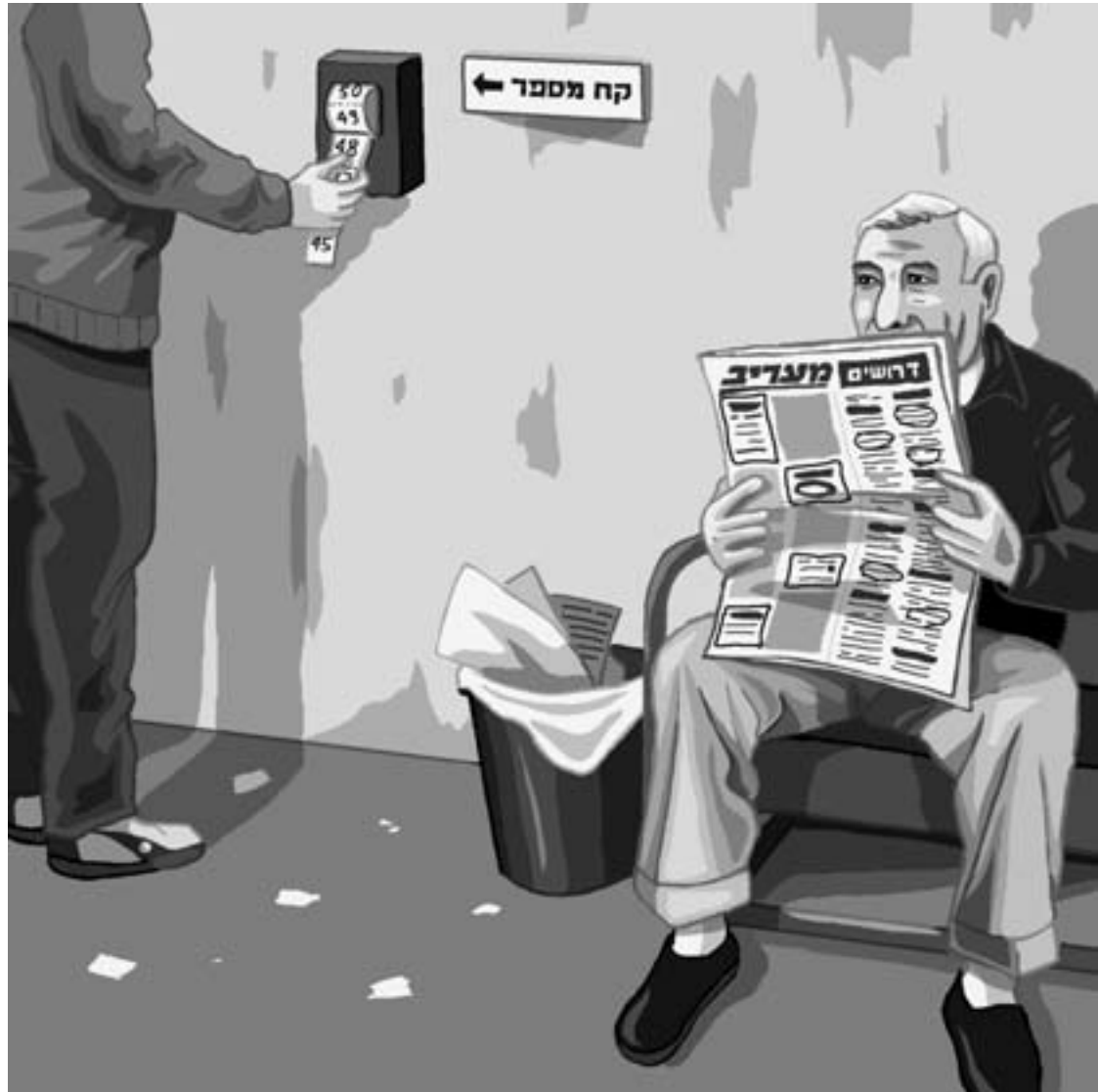
איור: גיא מורד

אני מפנה ראשי לצד שמאל, מנסה לתפוס דמות מוכרת; לשוחח. הכל כדי לשבור את הקיפאון הנורא, ואת מצב הרוח הקודר שהחל להשתלט עלי: אתה בפעם הראשונה כאן? שאלתי את שכני, חובש הכיפה. הוא נענע את ראשו בחיי וב, מבלי לומר מלה. נראה בעליל, כי גם עבורו, בדיוק כמוני, המעמד הנוכחי חדש בשבילו וקשה מנשוא. בעוד עיני ממשיכות לחפש "מכר" כלשהו מגיח במדרגות עובר נוסף. "חמישה נרשמים יכולים לעלות אתי לקומה השנייה", הוא קורא. בעוד כל הנוכחים תוהים לפשר הקריאה, אני מחליט לקום ולהתיי- צב מולו. מה כבר יכול להיות? במהירות עלינו, חמישה מובטלים, לקומה השנייה. נכנסתי לחדרו. הוא הציג עצמו בשם שהרכני.