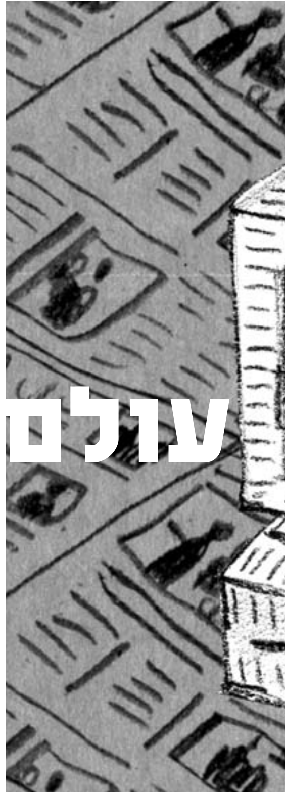
איוון: חיכל בוננו