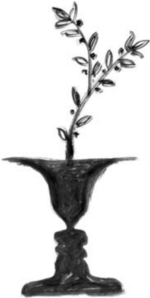
איור: רתם עמרי

גלטונג צבר ניסיון רב בסיקור תהליכי שלום בעולם ושימש יועץ בכמה מהם (כמו בשיחות המתנהדלות בשנים האחרונות בין שתי הקוריאות), וכנראה שהוא יודע על מה הוא מדבר כאשר הוא ממליץ לעיי־תונאים להימנע מלהגדיר כל מסמך שנחתם בין מנהיגי מדינות כשלום בין צדדים. עדיף לא להיסחף, לברוק אילו נושאים נשארו בלתי פתורים ועלולים להביא להתפרצות אלימה נוספת, ועד כמה מדובר לא רק בטקסים חגיגיים, אלא בתהליכים ממשיים, המשנים את האקלים שבו נוצר העימות. בעשרות אוניברסיטאות ברחבי העולם מלמדים היום את תפיסתו של גלטונג בנושא "עיתונאות שלום": חלק מן הרעיונות נוסו בפועל בידי עיתונאים בשולי אזורי הקרבות ביוגוסלביה לשעבר, כחלק מתהליך המעבר ממשטר האפרטהייד לשלטון הרוב השחור בדרום־אפריקה, בעימותים פנימיים בפיליפינים ובאינדונזיה ובעוד שורה של מקומות. אבל הזרם המרכזי של התקשורת במערב מתבונן, מן הסתם, ברעיונות הללו בצירוף של אדישות ורחמים: בסופו של דבר, גלטונג מבקש מן העיתונות הכתובה והמשודרת להחליף את עורה, לוותר על התמונה סוחטת הדמעות, על הכותרת טעונת הרגשות ולהחליף את אלה בדיון דקדקני ופרטני של מניעים, סיבות, גוני־גוונים של אבחנות והצעות לפיתרון – אותם הרגלים שהתקשורת מאז ומעולם התקשתה לנטוש.