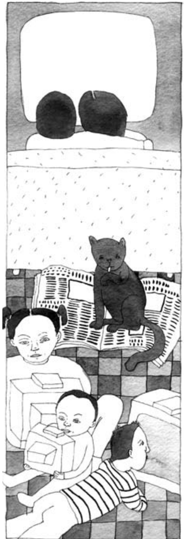
איור: יערה עשת

בשלב המיקוח, שעודנו בעיצומו, זכייני הערוץ השני שיפרו