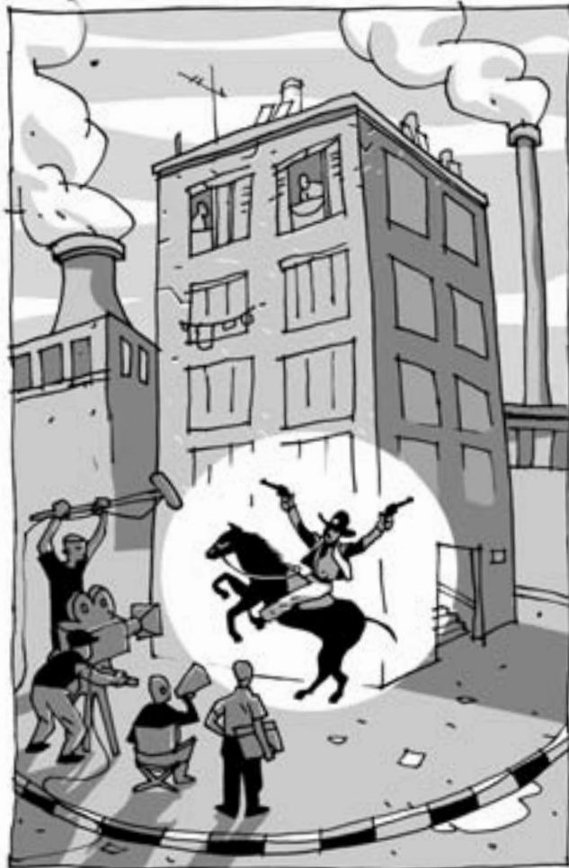
איור: אסף תנוכה

כקבוצת ביקורת למחקר זה נלקחו הקיבוצים. מאפייני האוכלוסיה הגרה בקיבוצים הם: יהודים, אשכנזים, חילונים, מודרניים,